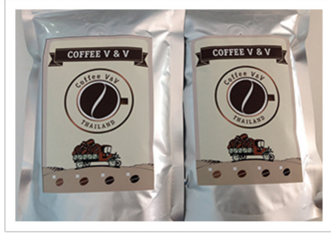
▲ COFFEE V & V

무엇보다 함께 커피를 만들고 마시면서 '하나님 나라의 가치'를 공유하도록 일상을 함께 하고 있습니다. 저희 커피 비즈니스는 플랫폼으로써, 내부적으로는 직원들이 달란트를 잘 발견하여 자신의 일에 자발성과 주인의식을 가지게 하며, 다른 비즈니스 아이템을 시도하게 하고, 외부적으로는 2월초까지 진행했던 인턴제도를 경험 삼아 인턴제도를 정착하여 BAM을 하고자 하는 사람들에게 실습장으로서의 역할을 하고자 합니다.